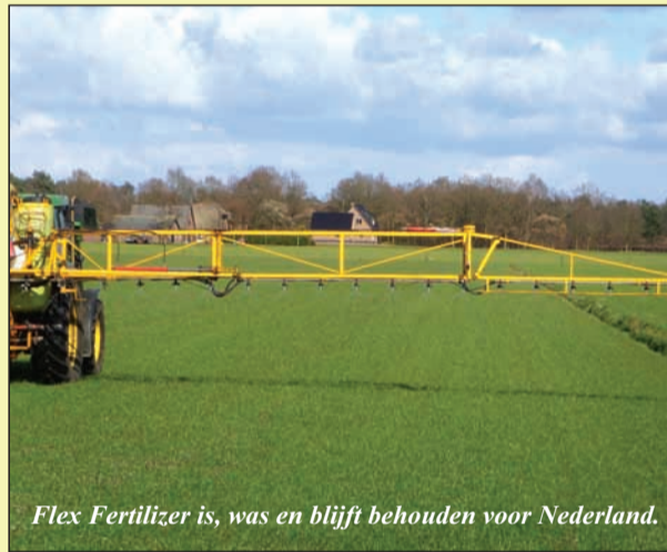
Flex Fertilizer is, was en blijft behouden voor Nederland.

se als wel op de Amerikaanse markt veelvuldig wordt toegepast, blijft zo ook voor Nederland behouden.