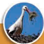
Value Added Logistics